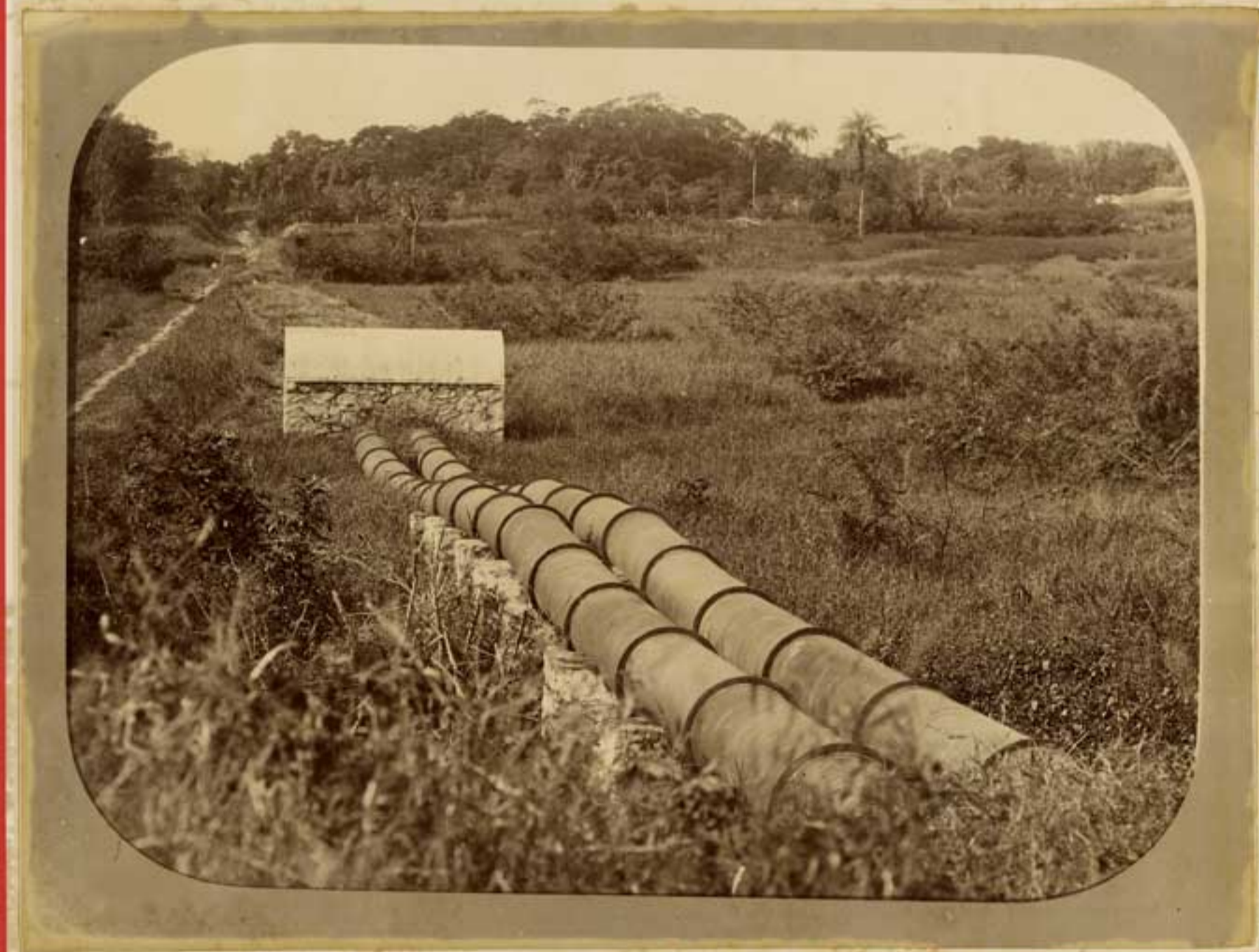
OBRAS DO ABASTECIMENTO D'AGUA DO RIO DE JANEIRO Empresa — A. GABRIELLI

Encanamento Geral. Passagem do encanamento sobre pilares, por cima do Rio Faria.