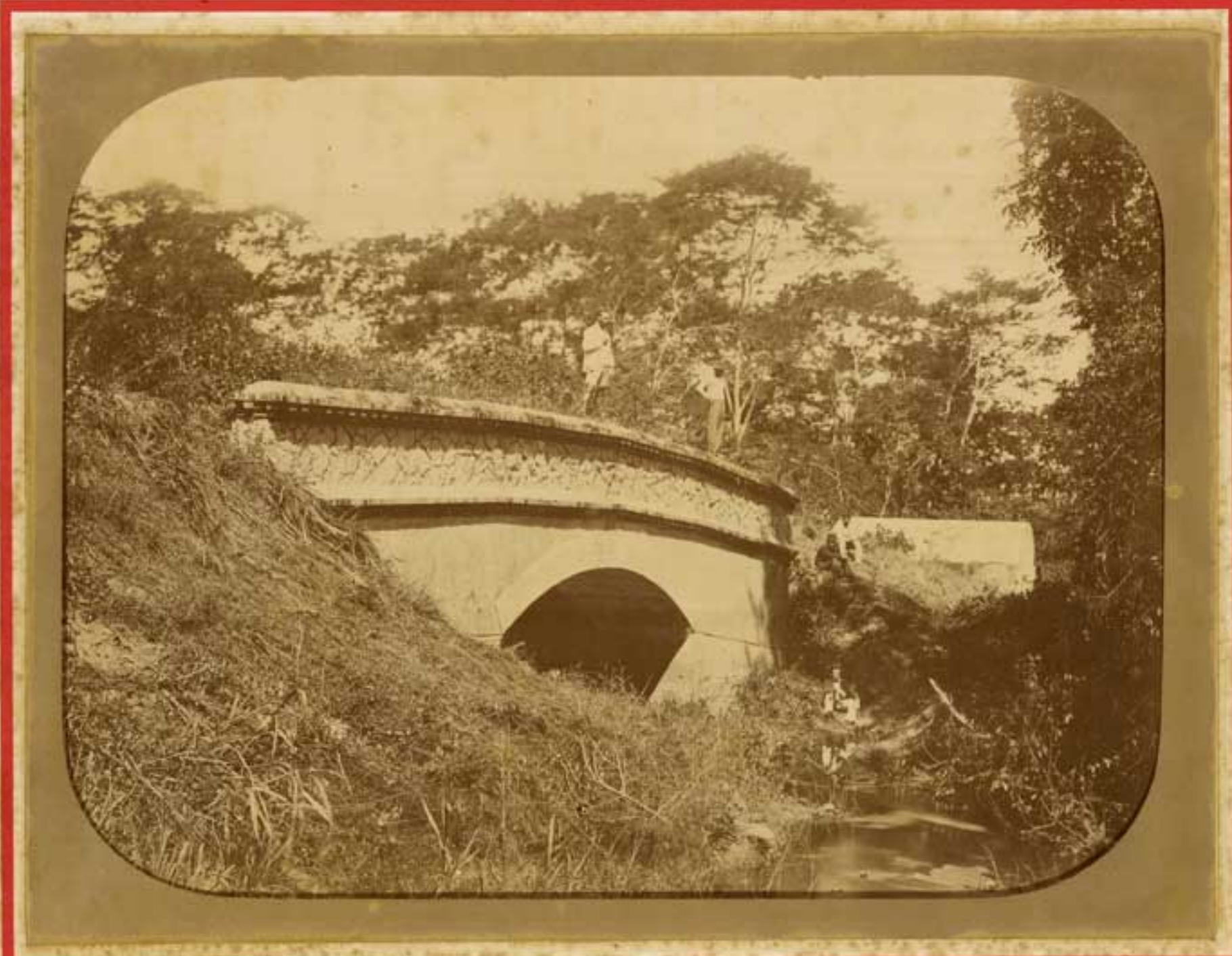
OBRAS DO ABASTECIMENTO D'ÁGUA DO RIO DE JANEIRO Empresa — A. GABRIELLI